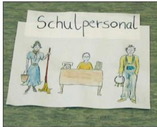
(Wünschestation „Schulpersonal“, gezeichnet von Julia Russau)

Hier noch einige Alternativverfahren für die Erhebung von Wünschen: